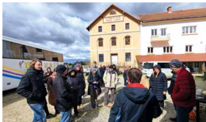
Slomškov mlin v Razkrižju že sprejema obiskovalce