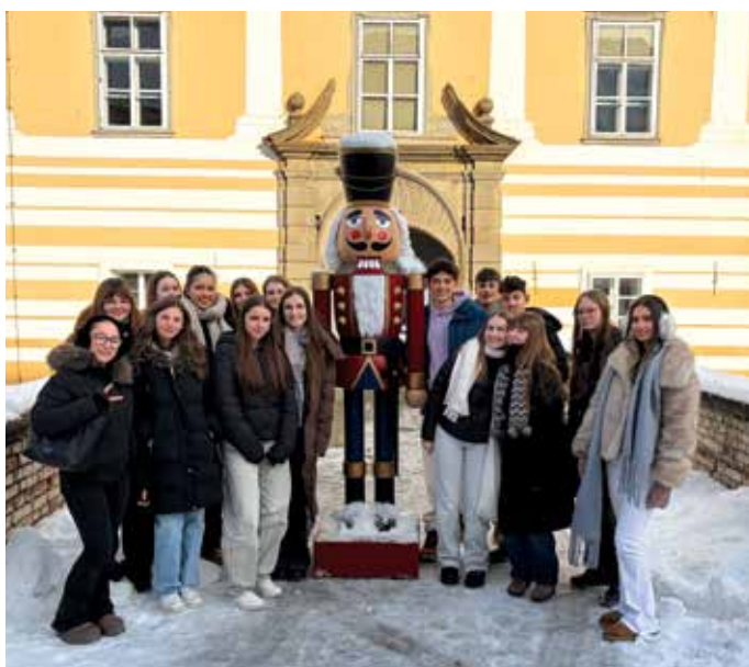
Nemški dijaki pri nas

Mladinske izmenjave temeljijo na neformalnem učenju, sodelovanju in osebnih stikih, zato imajo pomembno vlogo pri oblikovanju odprtih, samostojnih in odgovornih mladih.