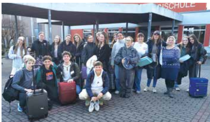
Pred šolo v Limburgu

V začetku leta 2026 smo na Srednji šoli Slovenska Bistrica gostili mlade iz Nemčije v okviru mladinske izmenjave Erasmus+ Mladina. V času njihovega obiska so slovenski in nemški dijaki sodelovali v ustvarjalnih in digitalnih delavnicah, raziskovali lokalno okolje in skupaj ustvarjali digitalne vsebine. Obiskali so Slovensko Bistrico, Maribor in Celje ter spoznavali kulturno dediščino in posebnosti našega prostora.