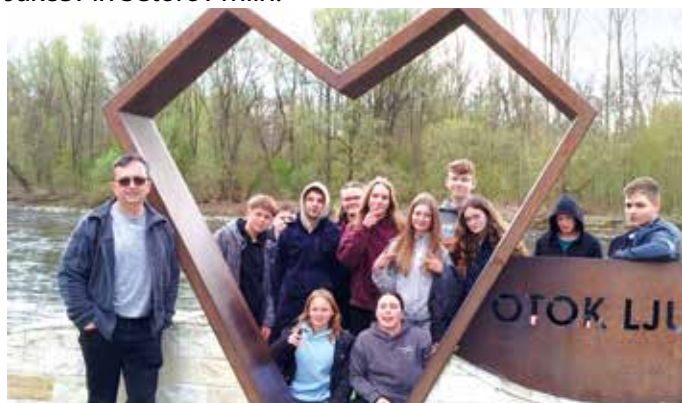
Učenci OŠ Šmartno na Pohorju pri mlinu v Ižakovcih

Temperature postajajo vedno bolj prijetne, zato smo v RIC Slovenska Bistrica pohiteli in še v zimskih mesecih izvedli izobraževanje za vodnike po razpršenem muzeju mlinov, o katerem smo pripravili nekaj prispevkov že v prejšnjih številkah. Izobraževanje, ki je potekalo pod okriljem Interregovega projekta čezmejnega sodelovanja med Slovenijo in Madžarsko, predstavlja niz aktivnosti in znanj, s katerimi smo želeli opremiti vse tiste, ki se ukvarjajo z organizacijo doživetij in vodenjem skupin ali pa jih preprosto zanima kulturno-tehnična dediščina vzhodnega dela Slovenije. Pri tem smo k sodelovanju povabili tudi osnovnošolce z bistriškega dela Pohorja, saj se v krajevnih skupnostih Tinje in Šmartno na Pohorju nahajata dva zanimiva mлина, ki sta na voljo za obisk: Jakčev in Šetorov mlin.