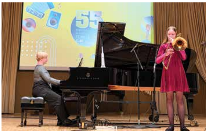
Slavnostni koncert prvonagrajencev 55. tekmovanja TEMSIG 2026